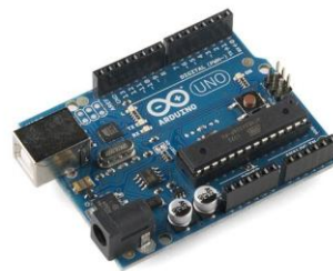
Figura 1- Foto da placa de controle Arduino UNO

Um dos melhores exemplos e um dos kits mais conhecidos de Open Source é a Arduino, apresentada na Figura 1. Ela é uma plataforma de prototipagem eletrônica de hardware livre, ou seja, ela é um microcontrolador embutido em uma placa com entradas e saídas, as quais podem ser conectadas em praticamente qualquer circuito eletrônico, bastando respeitar as características elétricas das portas. Por ser um hardware aberto, já possui uma comunidade de desenvolvimento viva e ativa, existindo incontáveis projetos diferentes disponibilizados de forma livre na internet. Alguns exemplos incluem projetos de iluminação usando LEDs [4], robôs diversos [5] e até mesmo estações meteorológicas para uso em estudos acadêmicos (PEZZI et al., 2012). Conseqüentemente, levando em consideração o custo, a flexibilidade e o grande número de desenvolvedores, a plataforma Arduino foi escolhida como a plataforma base, e o aluno que trabalhar com o kit também poderá continuar desenvolvendo projetos mais avançados posteriormente.