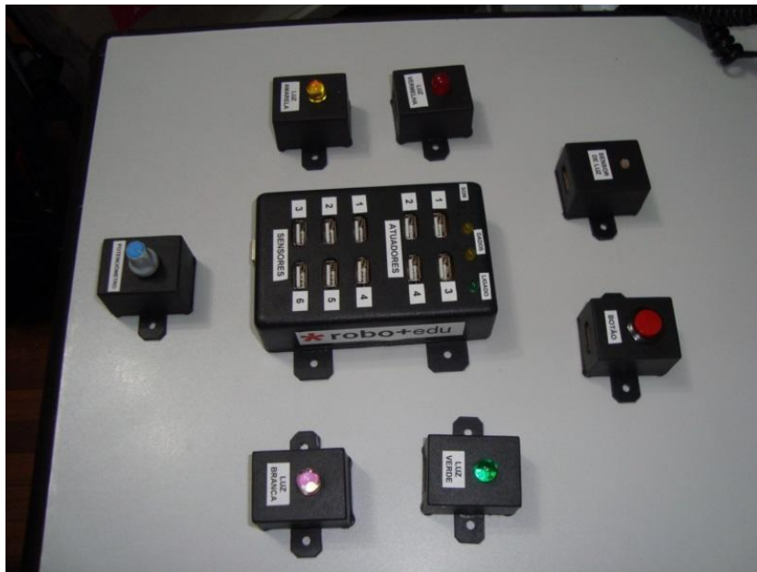
Figura 4 - Protótipo do kit ROBO+EDU

Para se construir novos componentes para o kit, o desenvolvedor apenas precisa garantir que eles sejam compatíveis eletricamente com a Arduino, ou seja, que não utilizem uma corrente superior a 40mA e funcionem com uma tensão de 0 a 5 Volts. Caso o componente exija maiores correntes, será necessário usar uma fonte externa para o componente.