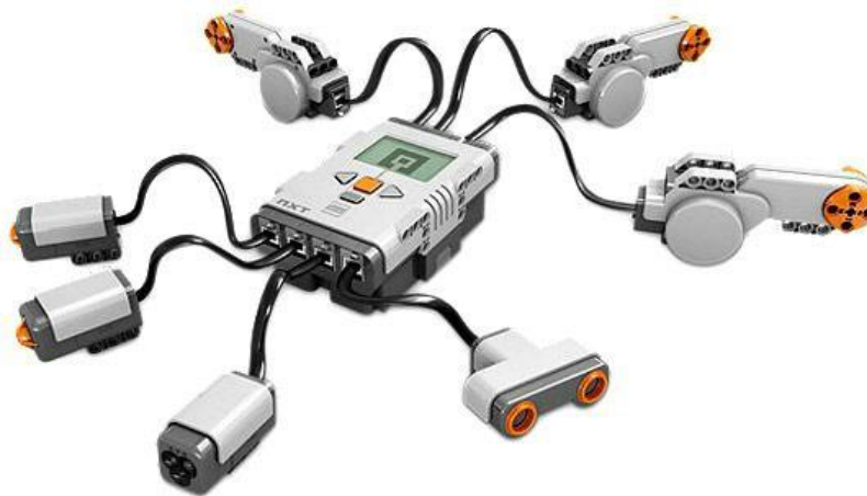
Figura 3 - Componentes programáveis do kit de robótica LEGO Mindstorms.

Com essas peças, uma infinidade de montagens diferentes podem ser feitas, mas, do ponto de vista do programador, o kit se resume ao que está descrito na figura 3: Sensores, controladores e atuadores. Toda a estrutura do robô poderia ser construída com outros materiais e deve ser levada em conta pelo programador, mas é desses componentes que ele possui controle direto, e é através deles que o robô interage com seu ambiente.